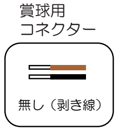
プッシュターミナル